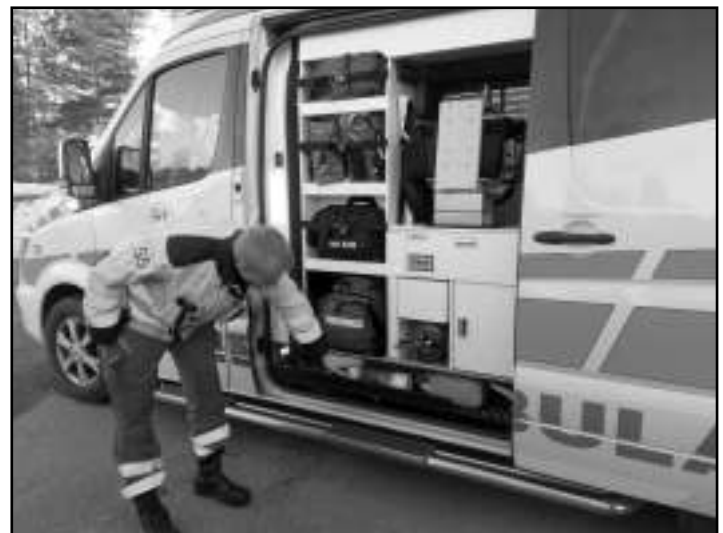
Sivulta löytyy mm. sammuttimia sekä köysivarusteet ja valjaat.