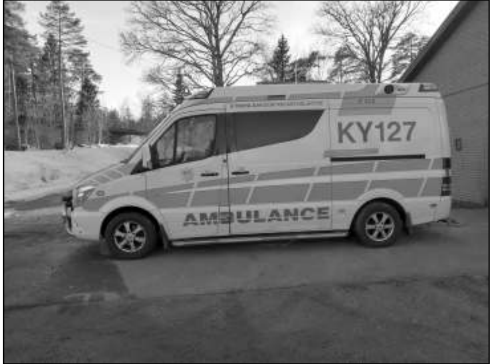
Monitoimiyksikön käytössä oleva ambulanssi.

Monitoimiyksikössä työskente- lee aina pelastaja Kymenlaak- son pelastuslaitokselta sekä hoitotason ensihoitaja Kymen- laakson sairaanhoitopiiriltä. Tällä hetkellä heidän autonaan toimii ambulanssi, joka on va- rusteltu normaalien ambulans- sivarusteiden lisäksi myös en- sisammutusvälineillä, kuten esimerkiksi heitinsammutti- mella sekä raivauskalustolla ja pintapelastusvälineillä. Uusi, juuri tähän tarkoitukseen suunniteltu auto on tulossa käyttöön hieman myöhem- min. Yksikön toiminta alkoi vuoden alussa asemapaikka- naan Miehkälän paloasema ja sen tarkoitus on hoitaa kii- reellisiä ensihoidotehtäviä, se- kä osallistua alueen kaikkiin pelastustehtäviin välittömällä lähtövalmiudella ympäri vuo-