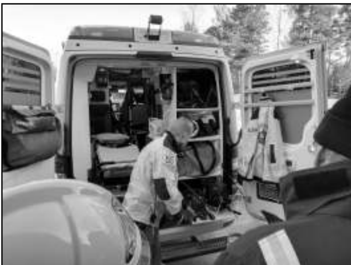
Ambulanssin takaosasta löytyy mm. pintapelastustarvikkeet sekä yhdistelmälevitin ja puukkosaha.