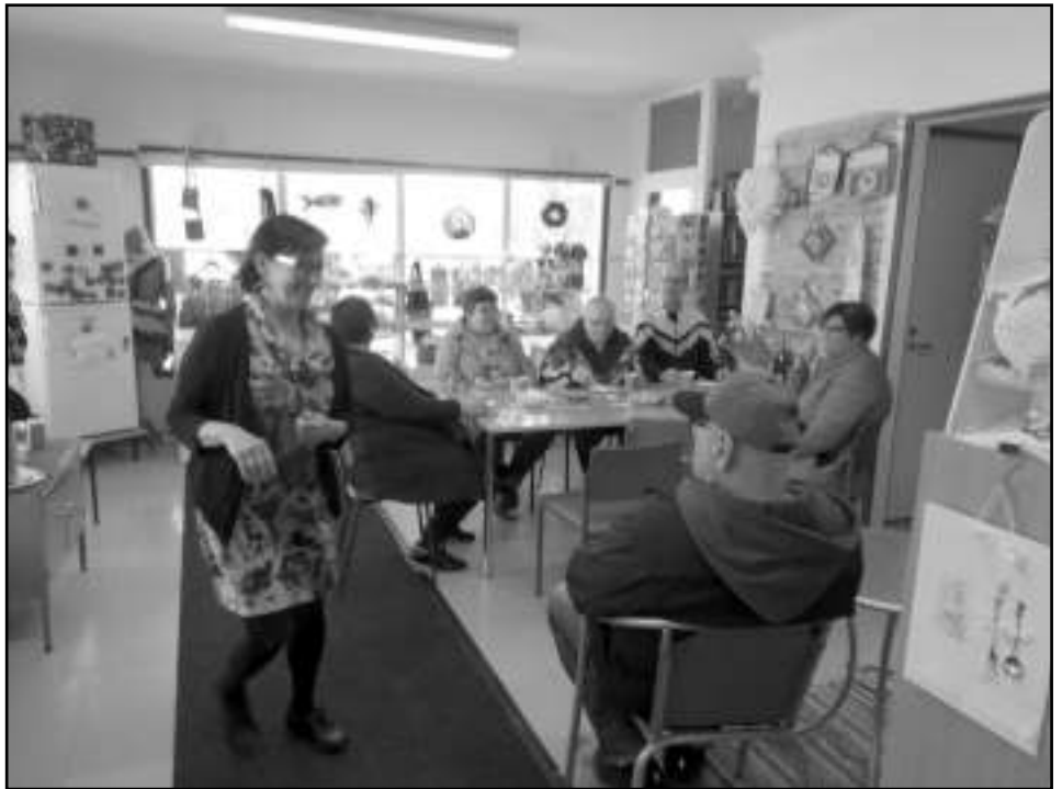
Pääsiäiskahvitus ja arpajaiset Kylätupa Ronkulissa 17.4.2019. Ronkulin naiset pitivät huolen että kahvipöydässä oli aina piirakkaa tarjolla ja kahvipannu kuumana.

Kesätorit alkavat pian, ehkäpä jo ennen lehden ilmestymistä. Kymmenen torikertaa, juhannusviikko jää välistä, eli viimeinen tori on elokuun puolivälissä. Ja muistatte varmaankin ajankohdan, perjantai-iltana ko 18 alkaen. Ja ne arvonnat alkavat klo