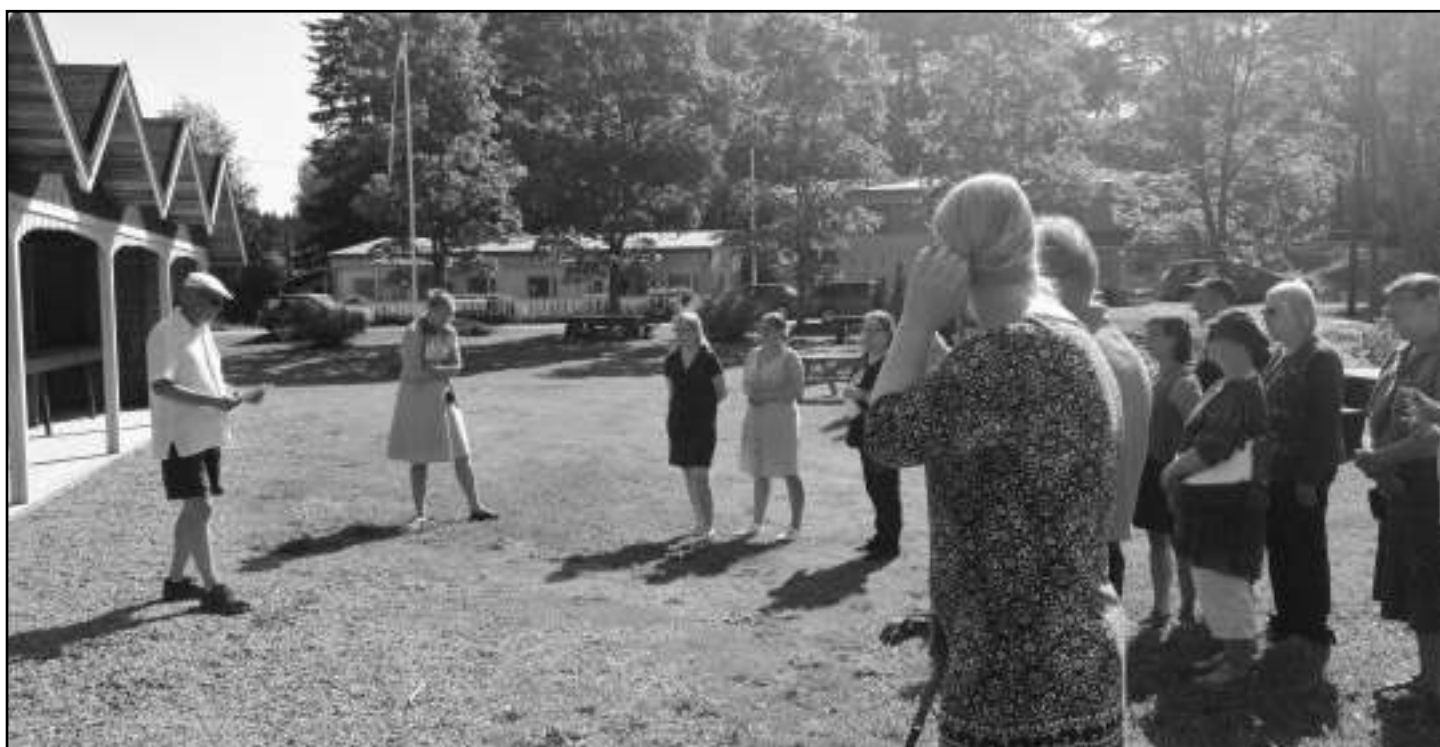
Erkki Kuparin kirjan julkistus.