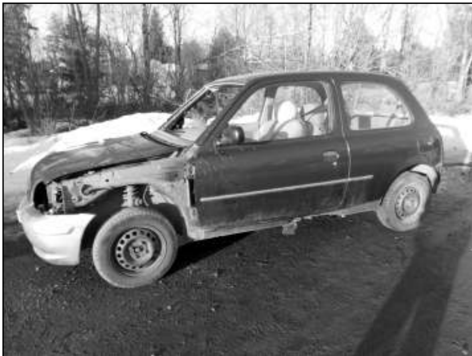
Liikenneonnettomuuteen joutunut ajoneuvo ja pelastettava uhri.

Kun edellä mainitut toimenpiteet oli ripeästi hoidettu päästiin potilaan luokse antamaan ensiapua. Tosi tilanteessa ensihoitaja olisi tästä eteenpäin kaiken aikaa potilaan luona, samoin pelastaja jos potilaan kunto niin vaatii. Jos tilanne ei olisi niin kriittinen ja ensihoitaja kykenee yksin varmistamaan potilaan turvallisuuden voisi pelastaja ryhtyä jo toimimaan lisäapua odottaessa, esimerkiksi irrottamaan ajoneuvon ovea, kattoa tms. mistä poti-