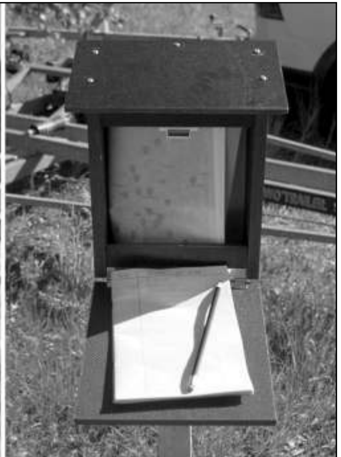
Mäntlahden kuntopuistosta löytyy Haminan pyörävaelluksen rastilaatikko.