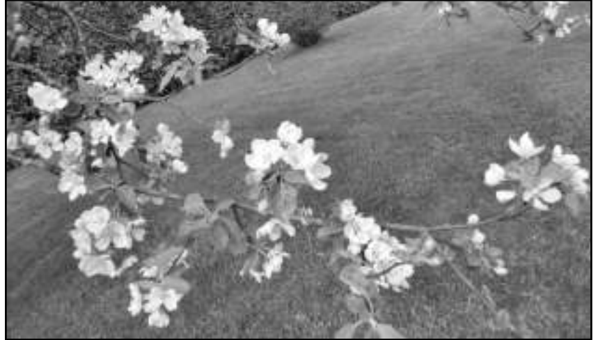
VALOKUVA VAPPU HARJUMAASKOLA