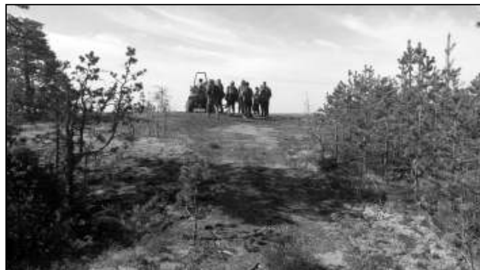
Vuoren valloitus päivä Laukko(u)vuorella Häppilässä.