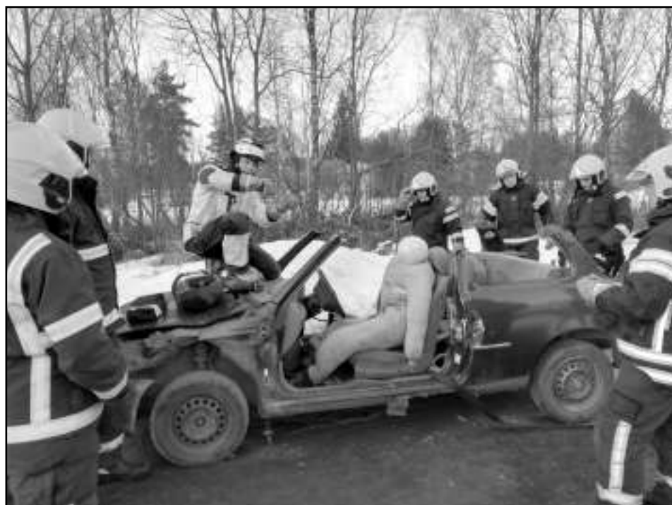
Lopputulokset: potilas saatiin onnistuneesti pelastettua! Auto tuki kärsi hieman käsittelyssä..