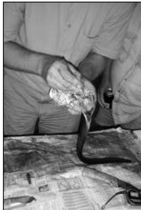
Ankeriastutkimusta Kalasataman hallissa vuonna 2007.