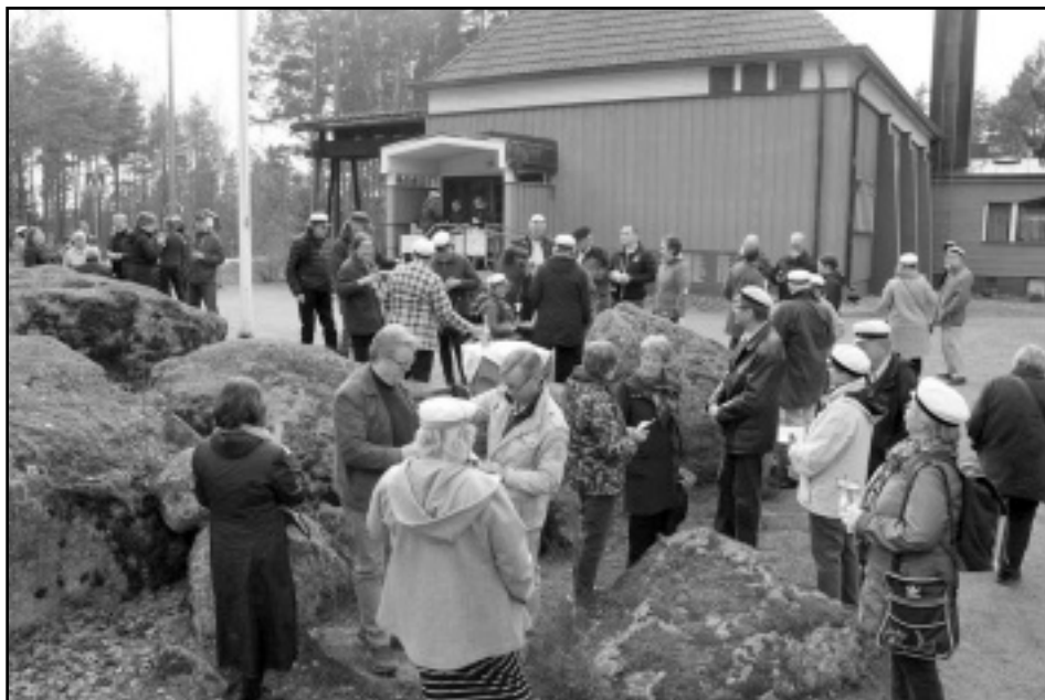
Olutsillan perinteinen Vappujuhla Klamilan kirkon edustalla.

den toisena lauantaina baari Kujansuussa, Klamilassa. Tapauksien teemat vaihtelevat tämän päivän polttavimmista aiheista aina historiallisiin aiheisiin ja kaikkeen siltä väliltä. Toisinaan tapaamisiin kutsutaan vierailevia luennoitsijoita eri aihealuiden asiantuntijoista. Luentoja on pidetty niin ikään kirjallisuuden saralta kuin puusuksistakin aina paikallisen olutpanimon toiminnan esittelyyn sekä oman kunnan tilannekatsaukseen. Nämä tapaamiset ovat kaikille avoimia