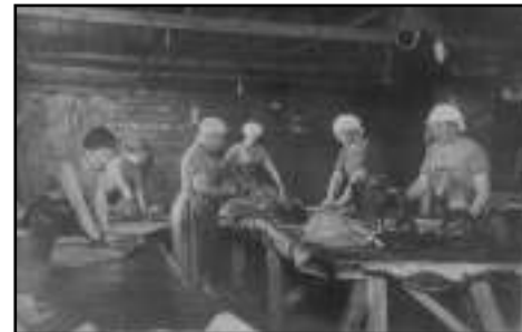
Sadetakkitehdas. Valokuva Puhjakunnankirjasta.