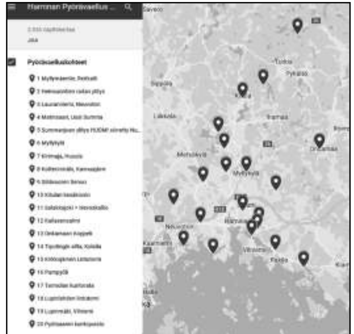
Kuvakaappaus Googlekarttana toteutetusta Pyörävaelluskartastasta.

Pyörävaellus 2019 sähköinen kartta: https://drive.google.com/open?id=1zACPIGGcXcv3h4StqQuil87aAnQUe6Kr&usp=sharing